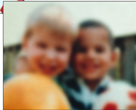
La misma escena vista por una persona con catarata.